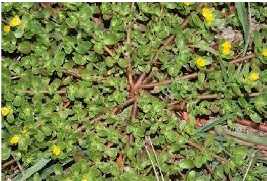
Imagem 2 - Portulaca oleracea , também conhecido como beldroega comum,

Com a montagem do protótipo foram iniciados experimentos com a beldroega, que consistiu em expor mudas ao Groot em um ambiente semi-controlado durante um período de horas em certos dias da semana. Após alguns testes com o protótipo foram necessárias pequenas alterações em sua estrutura a fim de melhorar a obtenção de informações sobre o desenvolvimento das beldroegas.