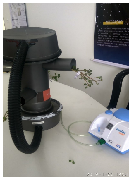
Imagem 4 - Primeiro modelo do protótipo Groot após alterações. Na foto testes com as beldroegas.