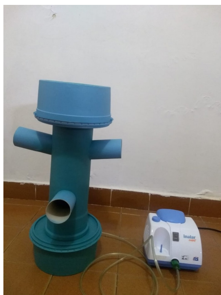
Imagem 3 - Primeiro modelo físico do protótipo Groot feito a partir de materiais recicláveis.