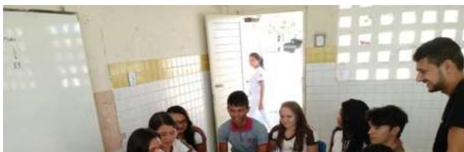
Figura 4. Aplicação do Jogo Lúdico.

O jogo foi adaptado de modelos já encontrados na literatura (SILVA; SANTOS, 2019), sendo que sua aplicação foi feita para familiarizar os mesmos com termos que também estariam presentes dentro da temática alimentos (Figura 4).