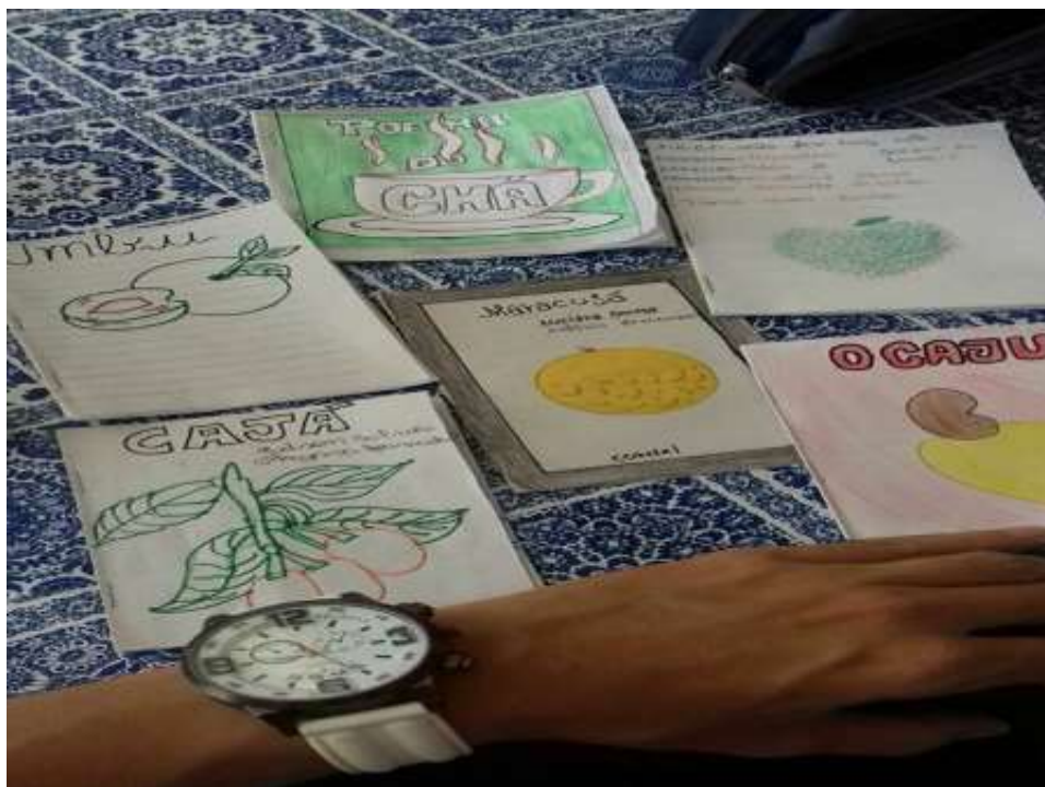
Figura 1. Cordéis elaborados pelos alunos.

Seguindo essa concepção, o trabalho foi feito de forma interdisciplinar com aulas que apresentavam o objetivo de instigar o aluno sobre a importância dos cordéis como representativo do histórico social da população. Foi demonstrada a construção estética e morfológica dos cordéis, além de declamações de cordéis de autores da região. Os cordéis produzidos mostraram êxito, com grande primazia como está sintetizado na Figura 1.