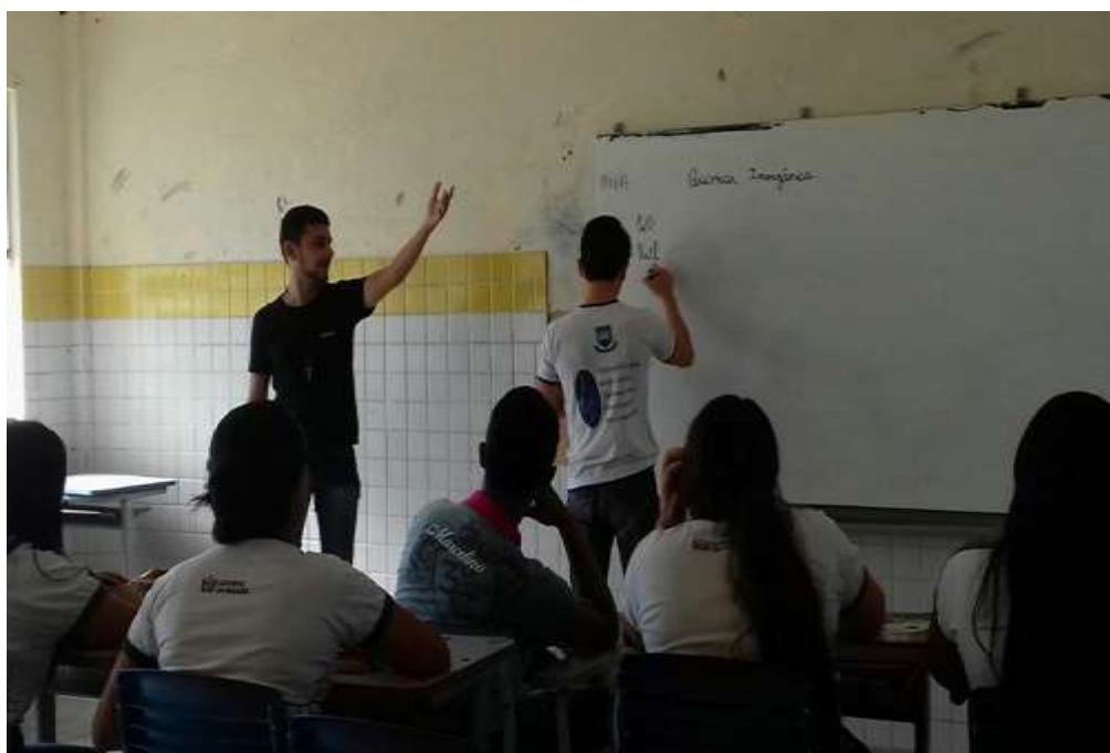
Figura 3. Aula sobre funções inorgânicas e o corpo.

Na Figura 3 percebe-se a aula teórica aplicada dentro da sala de aula que ocorreu como forma de um quiz com perguntas e respostas sobre química inorgânica, servindo também como base para a revisão sobre a referida disciplina.