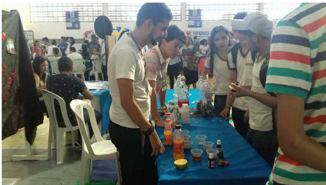
Figura 5. Apresentação dos resultados obtidos com a sequência didática.

Na etapa final do projeto se deu a apresentação de experimentos analíticos que apresentavam como intuito analisar de forma qualitativa a presença de vitamina C, amido e pH de sucos convencionais e industriais, analisando através do teste do iodo a presença de vitamina C. A culminância do projeto se deu na apresentação na Feira de Ciências da escola (Figura 5).