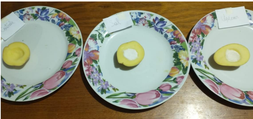
Figura 2: Experimento realizado por um aluno.

Outra atividade em que obtivemos um número significativo de devolutivas, considerando o número de alunos que ainda frequentavam as aulas remotas, foi a atividade prática para demonstrar o transporte pela membrana plasmática (Figura 2), que recebemos o total de nove (9) entregas. A alta taxa de devolutivas corrobora com as ideias de Hofstein e Lunetta (1982) de que as práticas despertam e mantêm a atenção dos alunos. Os alunos realizaram o experimento e, conforme combinado, enviaram um breve texto explicando o que havia ocorrido durante o experimento, concluindo que o transporte visto foi a osmose.