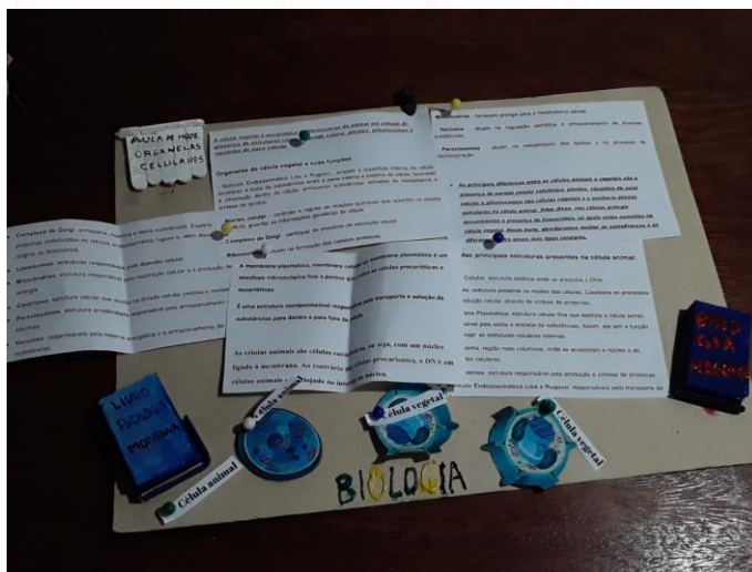
Figura 3: Lepbook confeccionado por um aluno.