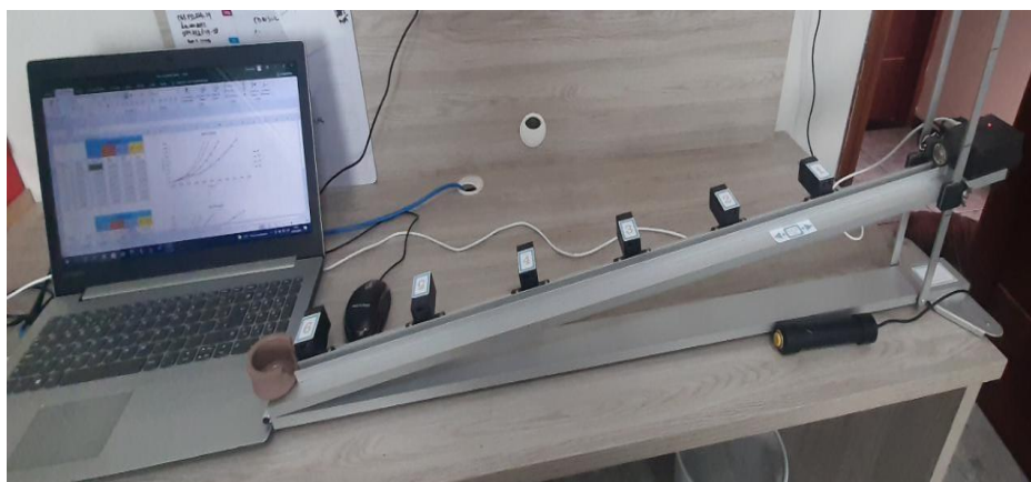
Figura 1 – Montagem do experimento Plano Inclinado

Os materiais utilizados na pesquisa foram disponibilizados em forma de um kit experimental, contendo um plano inclinado de alumínio com regulagem, gatilho de disparo, esferas de aço de diferentes massas, computador com software Excel, sensores de infravermelho, cabo USB, e foi montado conforme a figura 1: