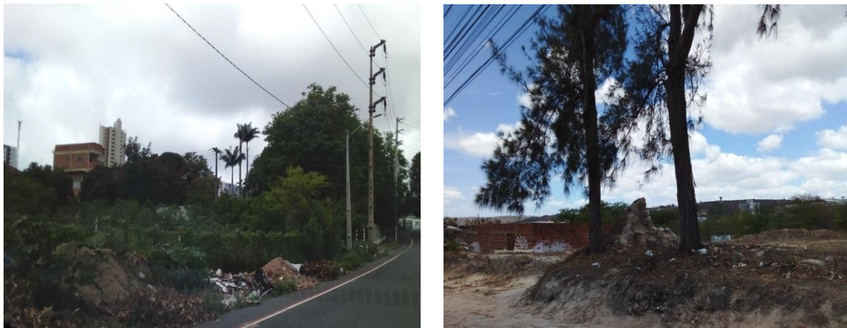
Figura 2- (A) RCDs depositados nas proximidades da UFCG na Rua Leniel Sucupira e (B) Resíduos lançados próximos ao açude de Bodocongó na rua Eng. Lourival Andrade.

Segundo Baptista Junior & Romanel (2013, p.4), a degradação ambiental causada pela “produção e descarte de resíduos da indústria da construção civil (ICC) é um dos mais impactantes do planeta, seja pela quantidade descartada ou pelo uso irracional das jazidas de recursos naturais”. A Figura 2, mostra os RCDs depositados nas proximidades da UFCG e resíduos lançados próximo ao açude de Bodocongó.