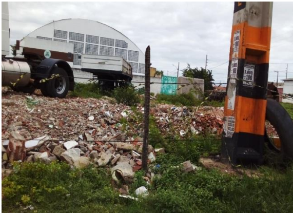
Figura 3- (A) Resíduos situados nas Av. João Wallig e (B) Av. João Wallig nas proximidades do Estádio Almeidão.