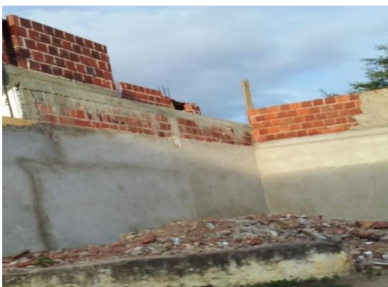
Figura 4 – (A) obra localizada no Bairro José Pinheiro e (B) Obra localizada no bairro Dinamerica, com geração de entulhos.

Atrelado a este fato, essa geração acentuada dos RCDs, provocam o acúmulo de resíduos no meio ambiente, muitos deles com elevado tempo de degradação como EPS, plásticos, polipropileno e PVC, dentre outros. Figura 4, mostra como os entulhos são disponibilizados no meio ambiente.