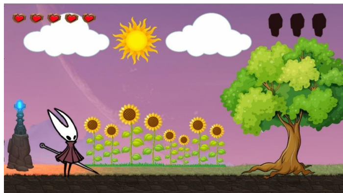
Figura 4: Imagem da 2ª fase do jogo didático digital Biocycle Adventure sobre o ciclo biogeoquímico do oxigênio.

A fase 2 trata do ciclo do oxigênio (Figura 4), mostrando elementos referentes a esse ciclo como respirações aeróbicas, fotossíntese e explicações no avanço do desafio, além de diversas estruturas criadas para cumprir o objetivo proposto pelo jogo, que é auxiliar no conteúdo de ciclos biogeoquímicos.