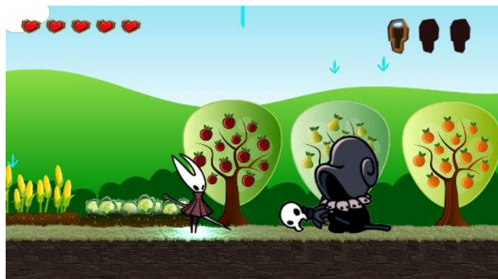
Figura 2: Personagens do jogo didático digital Biocycle Adventure (à direita o personagem principal e à esquerda o mestre de perguntas).

Ademais foi implementado um quiz de perguntas e respostas, criando funcionalidades responsáveis por guardar as perguntas e escolhê-las de forma aleatória, sendo o personagem mestre das perguntas responsável por analisar se a resposta está correta (Figura 2).