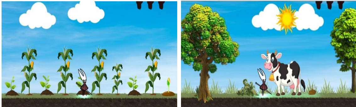
Figura 6: Imagens da 4ª fase do jogo didático digital Biocycle Adventure sobre o ciclo biogeoquímico do nitrogênio.

Por fim, a quarta e última fase refere-se ao ciclo do nitrogênio. Esse ciclo se divide em quatro etapas. São elas: fixação, amonização, nitrificação e desnitrificação. Foram adicionados elementos no cenário da quarta fase que remetem a essas quatro etapas citadas.