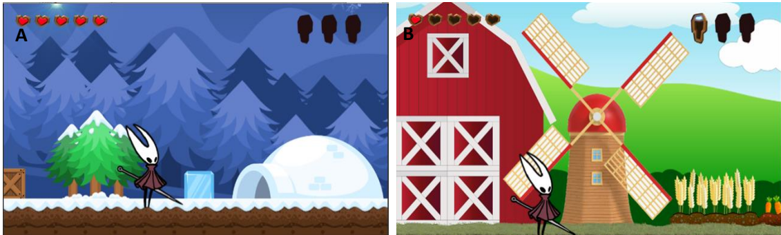
Figura 3: Cenário das geleiras (A) e cenário da fazenda/agrotóxicos (B) da 1ª fase do jogo didático digital Biocycle Adventure sobre o ciclo biogeoquímica da água.