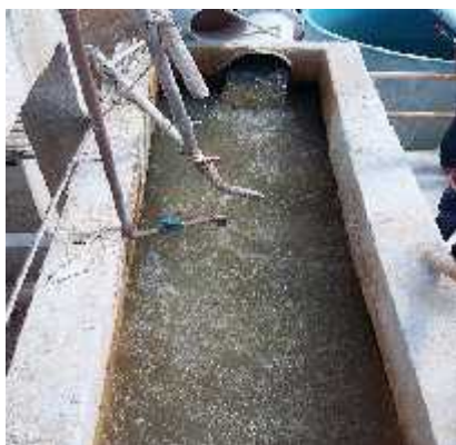
Figura 3: mistura da água com sulfato de alumínio e cloro.

falta de recursos químicos necessários para o seu tratamento e que seja aceitável para consumo humano. Na Figura 3, pode ser verificado o momento exato onde ocorre a mistura do sulfato de alumínio e do cloro na água a ser tratada (na ETA). Se a quantidade de água que é despejada nesse tanque for reduzida ou aumentada por um problema no bombeamento, os níveis dos componentes químicos encontrados na água serão consequentemente alterados.