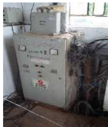
Figura 4: Bomba em situação precária e danificada.

Um exemplo desta situação pode ser encontrado na estação de captação, onde três bombas são responsáveis por sugar as águas do rio e enviar para a ETA. Durante a visita, foi percebido que uma delas estava sem funcionar (Figura 4), problema que só foi identificado devido à visita ao local.