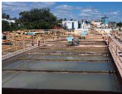
Figura 2: local para instalação dos sensores de temperatura da água (em todos os tanques).

Segundo a portaria N° 2914, de 2011 do Ministério da Saúde, a temperatura da água durante o tratamento deve ser próxima de 30°C, e os valores aceitáveis do pH da água variam a cada 5°C. Em nenhum momento, seja na captação, no tratamento ou na distribuição, a temperatura da água é verificada. Foi proposta a utilização de sensores de temperaturas na ETA, antes da coleta, para verificação das características físico-químicas no laboratório. Os sensores seriam instalados nos tanques mostrados na Figura 2.