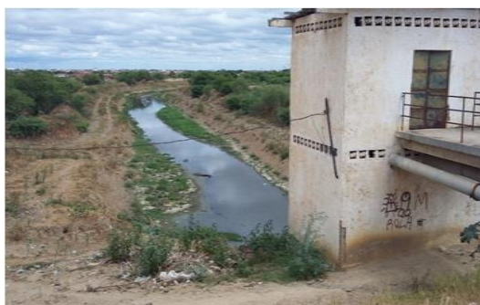
Figura 3: Esgoto tratado sendo remetido de volta para o rio.

A ETA tem dois reservatórios e quatro subestações que fazem o tratamento do esgoto, o processo de trabalho é antigo mais segue as normas nacionais para a descontaminação da água que volta para o rio. A Figura 3 mostra o momento que a água, após o tratamento retorna ao rio São Francisco.