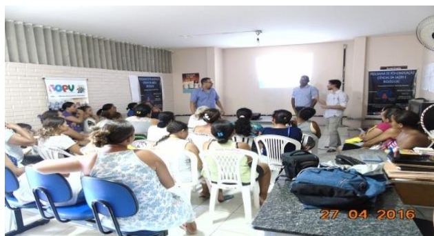
Figura 2: Palestra no CRAS com o tema “A Água na Promoção da Saúde”.

Foram mostrados dados comparativos dos bairros com menor e maior acesso ao serviço público de tratamento de água e esgoto no município e apresentado dados de casos de doenças de veiculação hídrica, a apresentação contou com informações importantes de quais os direitos e deveres da comunidade e da empresa prestadora de serviço, como agir em situações atípicas, como melhorar ou prevenir situações de riscos, como utilizar a tecnologia, formas alternativas de tratamento de água e outros temas, a Figura 2 mostra o momento da palestra a comunidade no CRAS.