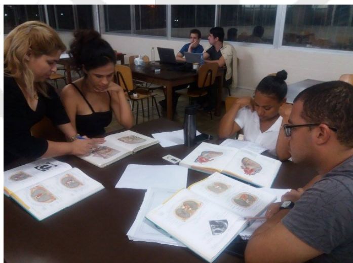
Figura 2: Resolução de questões e atendimento ao aluno.