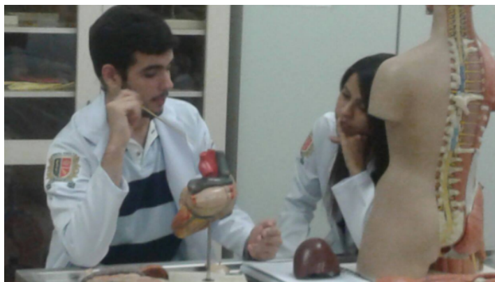
Figura 3: Aula de revisão com um monitor de anatomia.