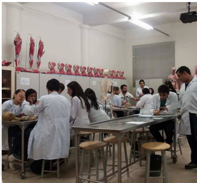
Figura 1: Aulas práticas de Anatomia I.

terem um acesso mais rápido à monitoria, bem como ao professor, para que as dúvidas não ficassem sem soluções, estreitando, dessa forma, a troca de informações, facilitando a elucidação de dúvidas e promovendo uma melhor comunicação monitor-aluno-professor.