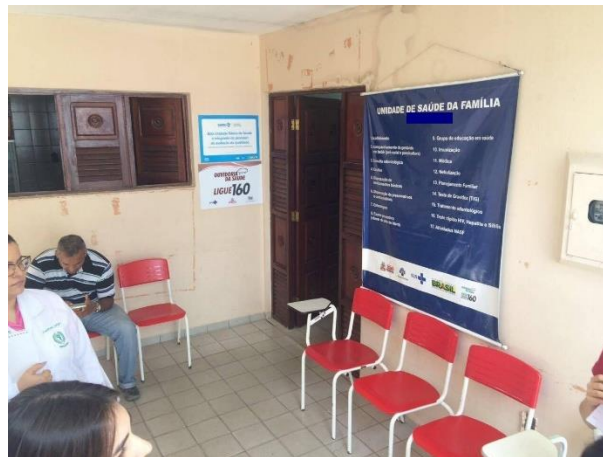
Figura 2: Sala de Espera