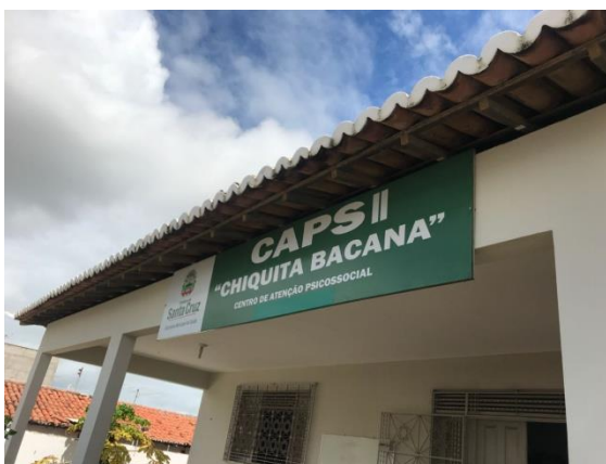
Figura 1: CAPS II “Chiquita Bacana”