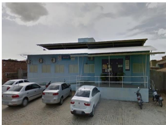
Figura 3: Unidade Básica de Saúde Francisca Francinete Paraíso II