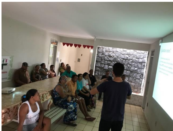
Figura 2: Apresentação da técnica para os usuários do CAPS II