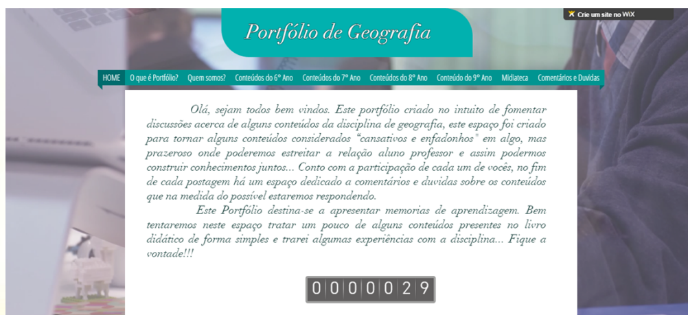
Figura 01: Imagem do portfólio produzido na plataforma wix.