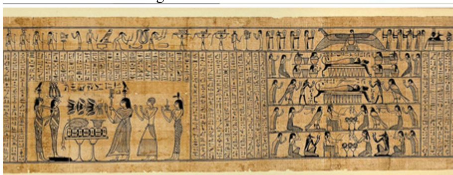
Figura 2 - Livro dos mortos