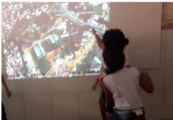
Figura 3. Localização do referênciã com Google Earth.