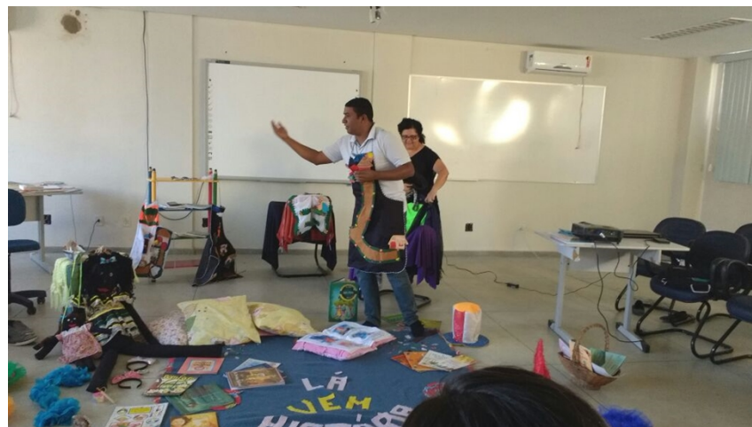
Figura 2 - Momento da Contação História

A mediação ocorrida no momento da historia pode se da através de várias formas. O avental é uma delas. Esse material expressivo permite ao contador trabalhar explorar o lugar onde a historia acontece a partir de uma performance na qual o seu corpo é suporte para o cenário.