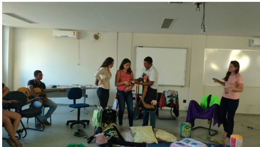
Figura 3 - Participação da Turma no Reconto da História.

A performance utilizada pelo contador precisa ser bem elaborada, pois só assim haverá uma proximidade física entre a sua ação narrativa e o ouvinte. Essa proximidade se dá pelas percepções e sensações construídas na atividade de apreciação desenvolvida pelo grupo que ouve a história. Na imagem abaixo registramos uma roda de contação de história constituída em uma atividade de itinerância desenvolvida pela Brinquedoteca em uma sala de aula do curso de pedagogia.