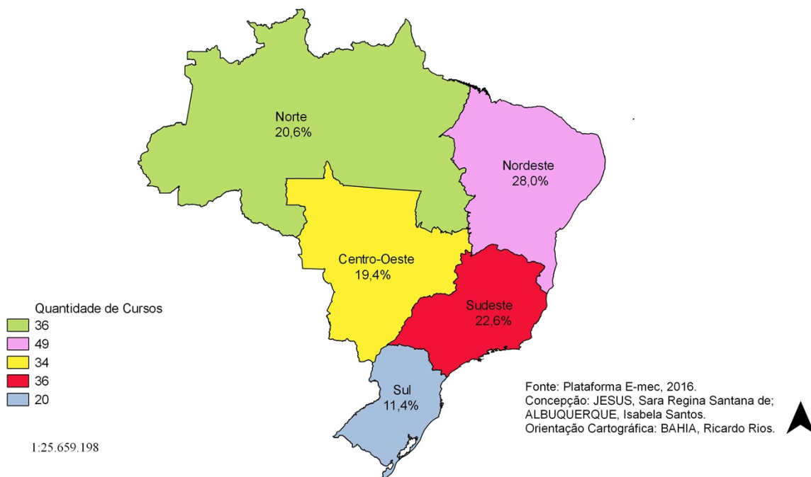
MAPA 02: DISTRIBUIÇÃO DOS LABORATÓRIOS DE ENSINO DE GEOGRAFIA E/OU INTERDISCIPLINARES - BRASIL, 2015-2016 .