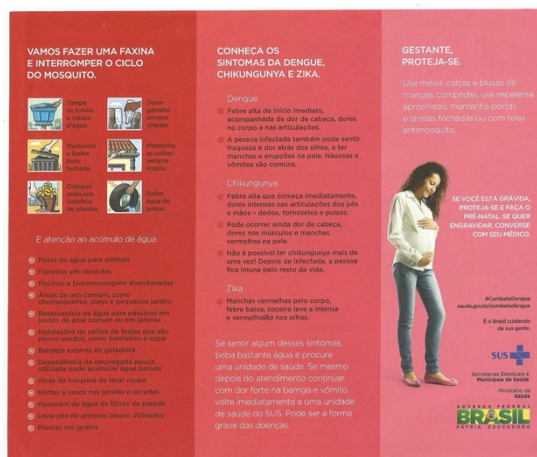
Imagem 1: panfleto modelo.

Pedimos que trouxessem alguns panfletos que encontrassem em supermercados, lojas diversas, postos de saúde... Após a coleta deste material, apresentamos ao grande grupo o que havia sido disponibilizado e fizemos os seguintes questionamentos: vocês conhecem este material? O que são? Como são chamados? Para quê são utilizados? Quem fez? A partir da resposta das crianças íamos fazendo intervenções, colocações, esclarecendo dúvidas...Explicitamos que cada panfleto tem o objetivo de divulgar ou informar sobre algo e neste modelo, em especial, tratar sobre assuntos relacionados ao mosquito Aedes Aegypti.