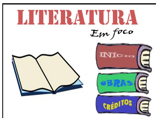
Figura 2 - Imagem da tela inicial do aplicativo (Login)

criado uma tela de login para que os docentes tivessem uma visão mais concreta do aplicativo e que não ficasse muito no fator imaginação, e que durante a pesquisa foi mostrado como o software visualmente pode ser e cada uma de suas funcionalidades que são exemplificadas a seguir.