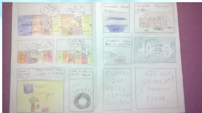
Figura 05 – Fonte: a autora

O grupo 05 desenhou um mosquito na capa e o título da história era “O Zika vírus”, tinham por personagens Beto e Júlio, que explicou detalhadamente como se transmite a zika e como podemos combater-la. Este foi o grupo que mais citou formas de combate ao mosquito. O grupo 06 relatou a história de 03 crianças que “pegou dengue” com a picada do mosquito e foram coletar os lixos para não acumular água e os mosquitos não nascerem, no caminho acharam bastante lixo que não sabiam onde colocar, o que também é um grande alerta quanto a sensibilização ambiental apresentada por alguns estudantes e o respeito ao meio ambiente. (Figura 05)