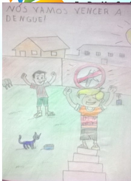
Figura 04