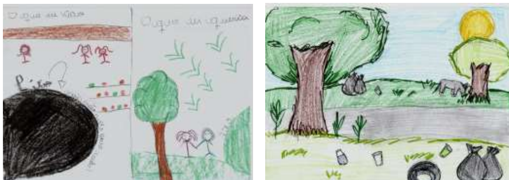
Figura 4: Mapas mentais com elementos que caracterizam aspectos antropocêntricos.

Por fim, constatou-se que a maioria das representações se enquadraram na categoria antropocêntrica (Figura 4). Fernandes, Cunha e Junior (2003) sugerem que tais expressões refletem um padrão mental intrínseco a cultura do ocidente, onde o homem é admitido como centro do mundo. Nessa visão, ainda é possível observar aspectos que reforçam o ser humano como figura a parte da natureza, fazendo uso desta apenas para extrair os recursos necessários para sua sobrevivência.