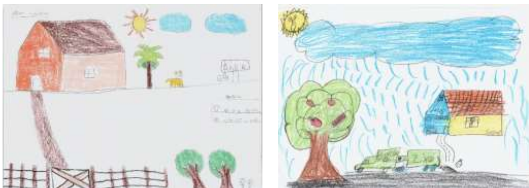
Figura 3: Mapas mentais com elementos que caracterizam aspectos globalizantes.