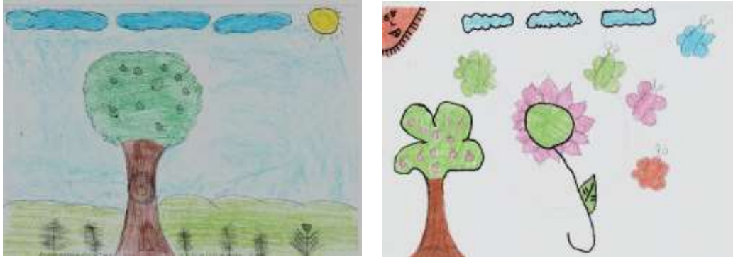
Figura 2: Mapas mentais com elementos que caracterizam aspectos naturalistas.

representações de flora foram ilustradas imagens de coqueiros, arbustos, gramíneas, árvores frutíferas, flores e hortaliças.