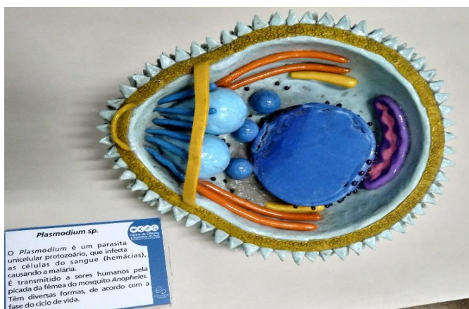
FIGURA 4 – Plasmodium sp. em biscuit

Com o intuito de possibilitar aos deficientes visuais acesso às informações referentes aos agentes causadores dessas doenças, foram produzidos, e encontram-se em exposição, modelos didáticos, como o do Plasmodium – protozoário causador da Malária (Figura 4). Além dos modelos, são expostas algumas amostras de vetores (insetos) preservados em meio líquido, que podem ser visualizadas através do uso de lentes de aumento.