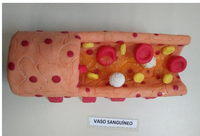
FIGURA 5 – Modelo de vaso sanguíneo

No que diz respeito a temática da organização do corpo humano, além de recursos tradicionalmente empregados no ensino de Biologia (torso e esqueleto humano), para apresentação de estruturas microscópicas também se lançou mão do uso do modelo didático em biscuit, como foi o caso do modelo de vaso sanguíneo em que se encontram representados inclusive os componentes celulares do sangue humano (Figura 5).