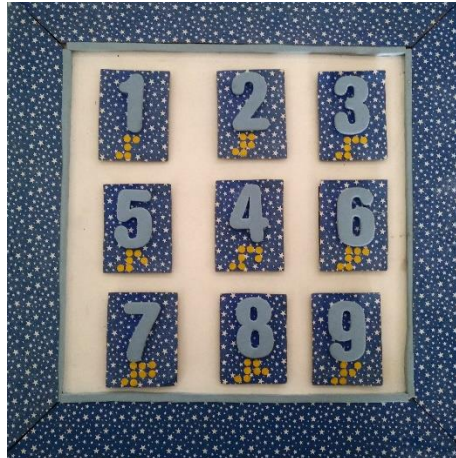
FIGURA 2 – Quadrado Mágico adaptado

Os jogos ou brinquedos educativos ao se constituírem em recursos que ensinam de maneira prazerosa, como é o caso da torre de Hanói e do quadrado mágico, evidenciam a relevância desse tipo de material em situações tanto da educação formal, quanto não-formal, ao possibilitar: a ação intencional (afetividade); a manipulação de objetos e o desempenho de ações sensório-motoras; a construção de representações mentais; e trocas sociais, ou seja as interações entre diferentes (KISHIMOTO, 2007).