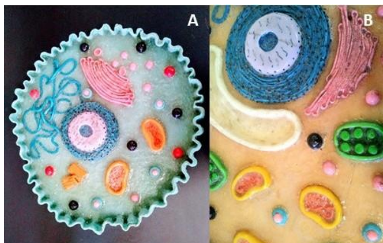
FIGURA 3 – Modelos – Célula Animal (A) e Célula Vegetal (B)

2. Plasmodium em biscuit: No espaço de Doenças Tropicais e o Homem encontra-se material representativo da organização do corpo humano, desde a estrutura molecular até os diversos sistemas, além de possuir informações sobre os principais agentes e