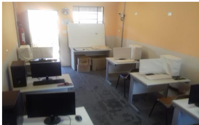
Figura 1: Laboratório de Informática da ABACO

Em relação aos resultados alcançados com o projeto, os participantes puderam conhecer e utilizar os recursos de informática, assim como também aprender a criar textos e apresentações próprios a partir dos conhecimentos adquiridos nos cursos. Por consequência, desenvolveram habilidades que os permitiram a inserção/inclusão destes no mundo digital e, conseqüentemente, no mercado laboral. A figura abaixo mostra a sala de Informática da ABACO onde aconteceram as aulas de informática.