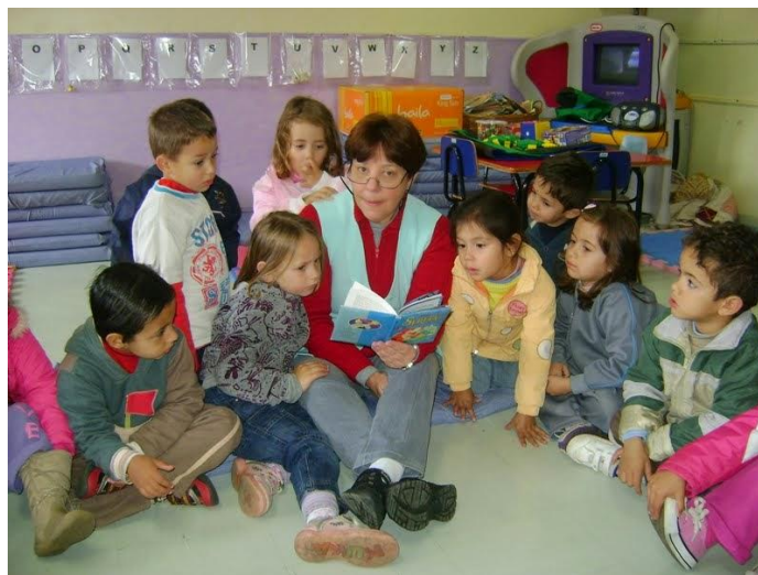
Figura 3: Trabalho Psicopedagógico

O trabalho do psicopedagogo pode ser feito de forma lúdica, trabalhando as dificuldades em forma de jogos, como também através de palestras, orientação para pais, além de auxiliar os professores e demais profissionais nas questões pedagógicas. Sendo necessário solicitar a cooperação dos familiares para manter a mesma postura em casa, será de suma importância a participação ativa da família na intervenção psicopedagógica, podendo ser realizada pelo profissional algumas sessões com o grupo familiar, de forma que a intervenção seja uma linha tênue e eficaz.