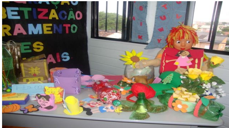
Figura 1: Sala de Atendimento Especializado (AEE)

possível uma compreensão clara que a aprendizagem envolve muitas variáveis e aspectos, como questões sociais, biológicas e cognitivas. No questionário também fora perguntado se saberiam diferenciar Transtorno de Dificuldade de Aprendizagem, na qual obteve a resposta sendo como positiva.