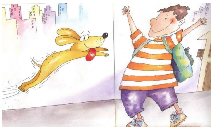
Figura 2: O encontro

O que mais chama atenção no livro são os momentos que o menino passar por todos os cômodos da casa até chegar seu destino final: o esperado encontro com o “seu melhor amigo”, o cachorro. Eis uma das imagens mais sensíveis e importantes da história: