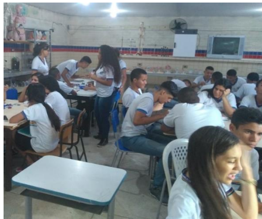
Figura 2. Aula 1 – Grupos classificando os artrópodes

Observou-se certa homogeneidade entre as turmas sobre as equipes que apontaram caramujos também como artrópodes, mesmo com o conteúdo de moluscos tendo sido visto anteriormente. Nas cinco turmas, uma das quatro turmas formadas apresentou um caramujo como artrópode.