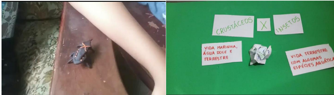
Figura 5 e 6. Imagens dos stopmotion com artrópodes como vetores de doenças e diferenças entre as classes.

A utilização de ferramentas diversificadas em sala de aula surgem como opções para estimular o aprendizado. Atualmente se faz necessário incentivar o uso de novas metodologias educativas, que não sejam baseadas na forma tradicional de transmissão do conhecimento, mas que consigam atender às expectativas dos envolvidos no processo de aprendizagem.