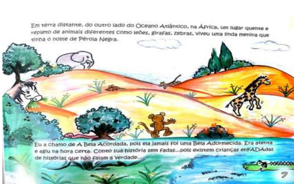
FIGURA 2 – Literatura Brasileira “A Bela Acordada” p.7

Fonte do Livro:Autora: SANTOS, L P dos,( 2011)