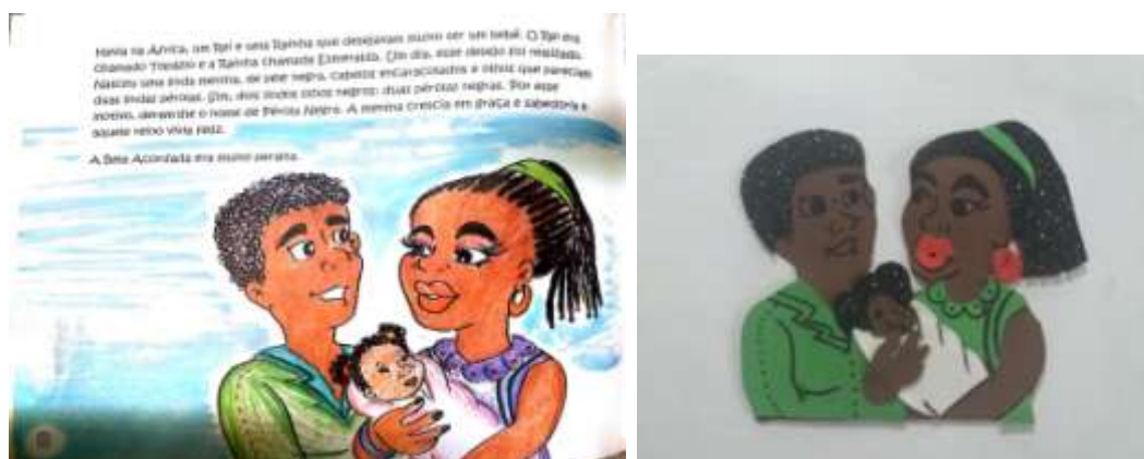
FIGURA 3 – Adaptação “A Bela Acordada”p.8

Fonte Autora: PAIVA, L L M (2019) Adaptação experimental em braille, tinta ampliada e figuras representativas táteis – esboços provisórios.