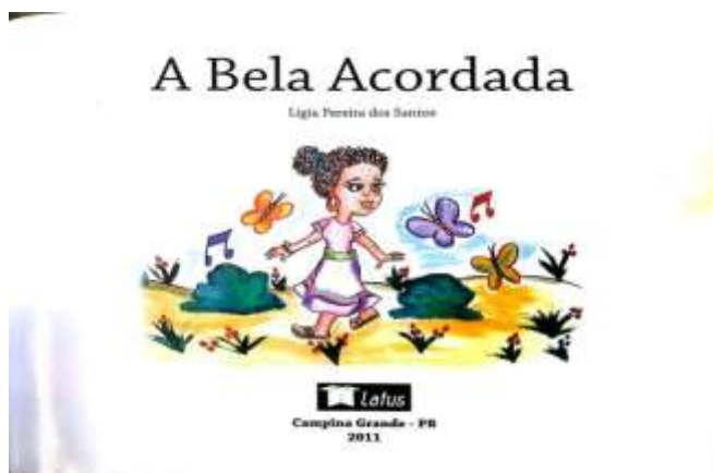
FIGURA 1 – Literatura Brasileira “A Bela Acordada”

Fonte do Livro: Autora: SANTOS, L P dos,( 2011)