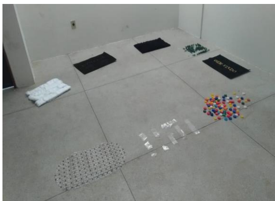
Figura 1 - Caminho sensorial

Os participantes entraram na sala de olhos vendados e descalços sendo acompanhados pelos ministrantes. Na sala havia um ambiente com tapetes e objetos espalhados de diferentes texturas de formando um caminho. Esse caminho teve como objetivo mostrar as diversidades de percepções que cada pessoa tem sob seu entendimento de mundo o qual foi aguçado apenas pelo tato.