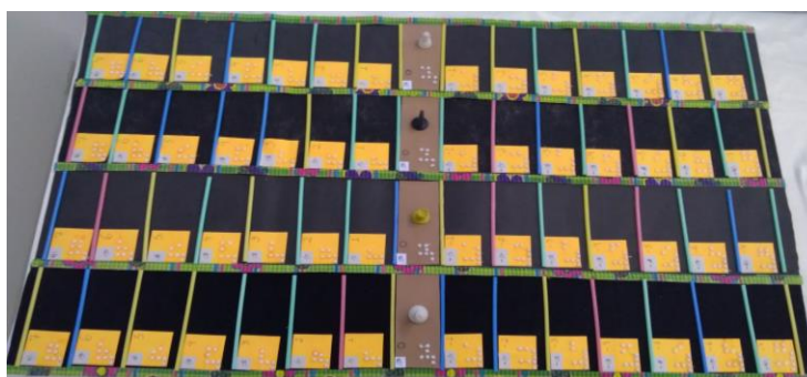
Figura 3 – Tabuleiro do jogo “Caminhando com os inteiros”.