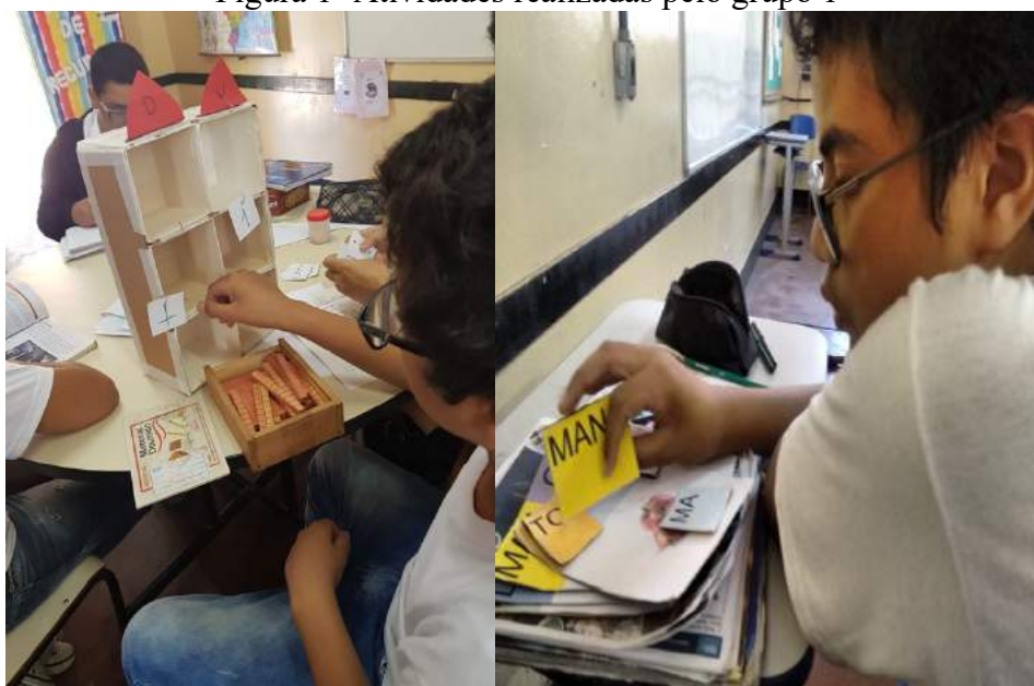
Figura 1- Atividades realizadas pelo grupo 1

O primeiro grupo foi formado pelas disciplinas de Língua Portuguesa, Matemática e Inglês. Os docentes utilizaram recursos didáticos concretos na realização das suas atividades. Veja figura 1: