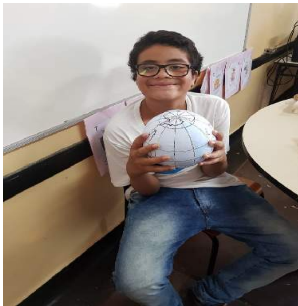
Figura 2- Atividade realizada pelo grupo 2

Esses professores executaram suas atividades após a realização de uma bola com a imagem do mapa do mundo. O aluno pôde explicar onde ele morava, quem ele era, e porque ele ganhou o mundo. O objetivo foi trabalhar além da identidade e conceitos geográficos, o sentimento de pertencimento, e motivá-lo na realização de novas atividades. Veja figura 2: