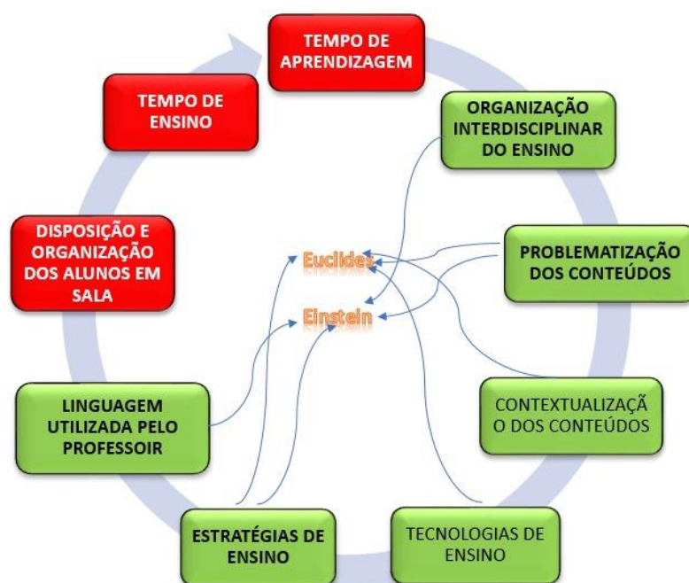
Figura 02: Elementos e momentos que limitam ou potencializam as práticas metodológicas com TCC