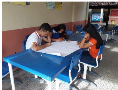
Imagem 5 à 8: Criação de desenhos e escolha de imagens do filme

Depois deveriam pesquisar frases motivacionais e/ou de efeito relacionadas ao filme e produzir um texto, do gênero textual sinopse, para tanto foi realizada leitura com os alunos individualmente, para orientações de como organizar as informações coletadas. A sinopse era para que outras pessoas lessem e tivessem conhecimento sobre o filme e assim despertassem o interesse para assistirem.