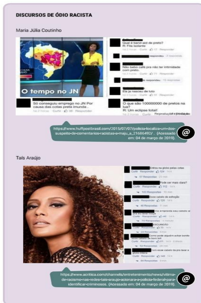
Figura 1: texto do campo jornalístico-midiático