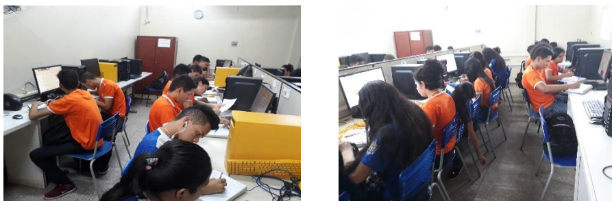
Imagem 1 e 2: Pesquisa na Internet

Posteriormente foi solicitado aos alunos que realizassem pesquisas acerca do tema no laboratório de informática da escola de forma que a navegação e coleta de dados na web enriquecesse seus conhecimentos e informações.