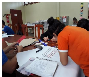
Imagem 9 e 10: Produção das Sinopses

Após todas essas atividades foram expostos os cartazes no 1º Plantão Pedagógico realizado na escola dia 08/06/2019, com o intuito de que os alunos de outras turmas e pessoas que circulavam neste dia pudessem observar os trabalhos, como forma de interagir a partir das atividades realizadas pelos próprios estudantes dando assim uma maior importância e valorização às suas produções.