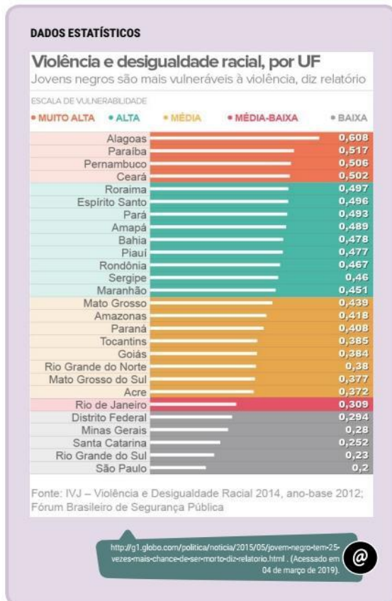
Figura 2: dados estatísticos