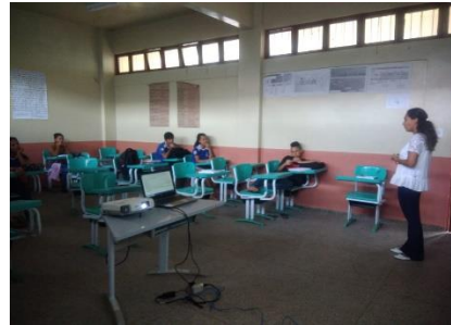
Imagem 3 e 4: Sessão de filme e socialização

Nas socializações os estudantes tiveram uma atitude mais responsiva em que relacionaram os elementos presentes no filme com a temática até então estudada, debatida e pesquisada, percebeu-se que muitos alunos se emocionaram e em seus relatos desmonstraram estar motivados a prosseguirem seus estudos e não desistirem mesmo com as dificuldades que surgissem em suas vidas. Neste momento viu-se a importância em oferecer momentos de reflexão como prevê os PCN's "O aluno ao compreender a linguagem como interação social, amplia o reconhecimento do outro e de si próprio, aproximando-se cada vez mais do entendimento mútuo" (2002, p. 130).