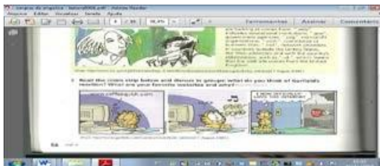
Fig.1 Atividade 1 (SANTOS, 2010a, P.56)

De acordo com os direcionamentos da atividade 1, os alunos necessitam atuar colaborativamente. No tocante à primeira pergunta, os alunos são motivados a ler os três quadros da tira para respondê-la, o que propicia o uso das seguintes estratégias metacognitivas: objetivo da leitura, levantamento de hipóteses (predições) e ativação do conhecimento prévio. A pergunta torna-se o objetivo dos alunos em compreender a tira, então, eles necessitam levantar hipóteses (predições) e as confirmar a partir da leitura de informações visuais e de seus conhecimentos prévios relacionados à personagem Garfield e às compras que são realizadas na internet.