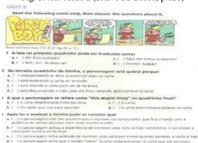
Fig. 3. Atividade 2 (SANTOS 2010a, p.120)