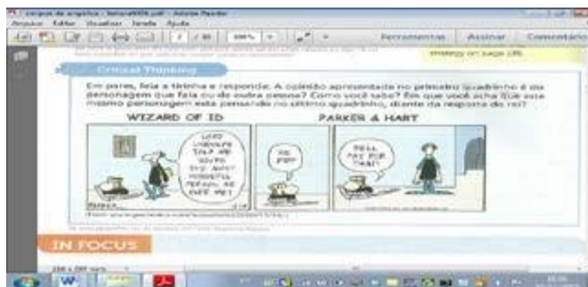
Fig. 4. Atividade 3 (Santos 2010b, p. 52)

A atividade 3 trata-se novamente de uma atividade colaborativa. Logo no início, solicita que os alunos precisam formar pares no intuito de respondê-la. Como objetivo de leitura , a atividade pede que os alunos leiam o balão do primeiro quadrinho para, então, responder o que ela pede: “A opinião, apresentada no primeiro quadrinho é do personagem que fala ou de outra pessoa? Como você sabe? Em que você acha que este mesmo personagem está pensando no último quadrinho, diante da resposta do rei?”