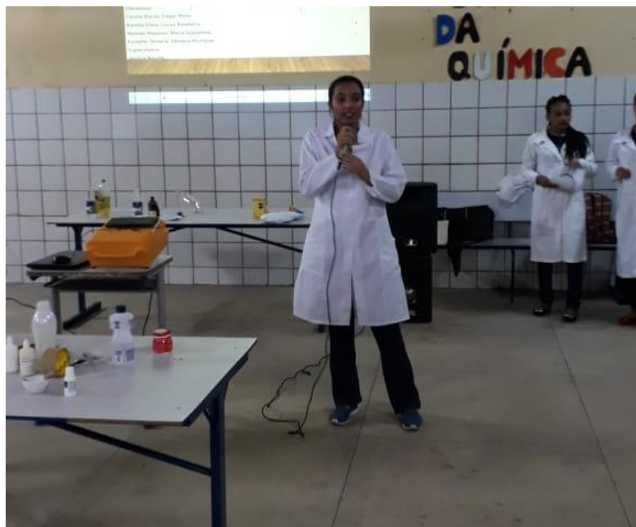
Figura 3: Organização do quis.