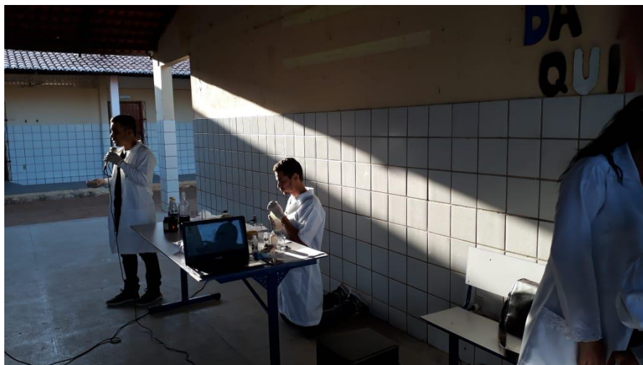
Figura 2: Explicação dos experimentos.