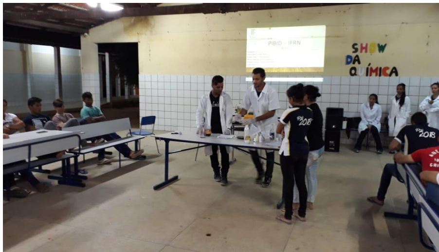
Figura 1: Desenvolvimento dos experimentos, junto na participação dos estudantes.