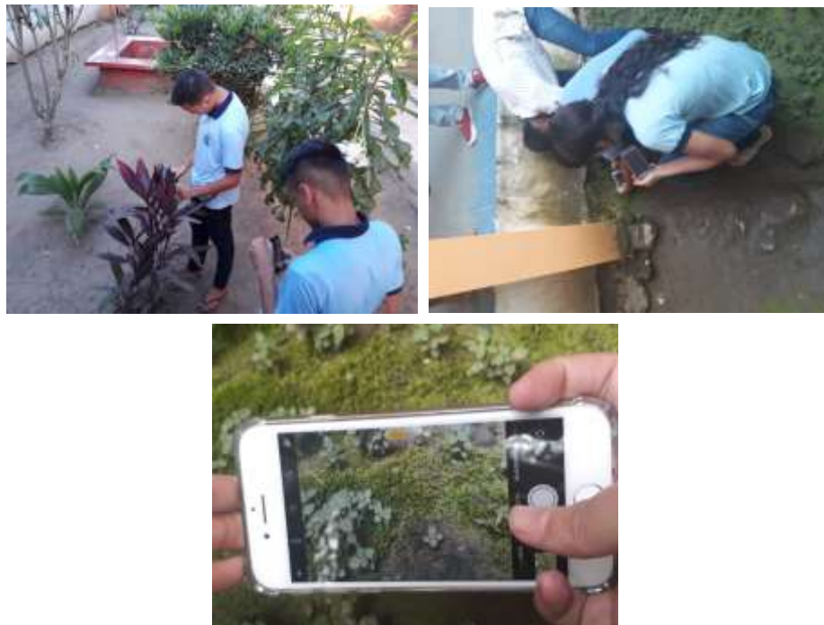
Figura 2 – Registros para o Álbum Virtual dos estudantes do 2º Ano do Ensino Médio da EEEFM Otávia Silveira em Mogeiro/PB .