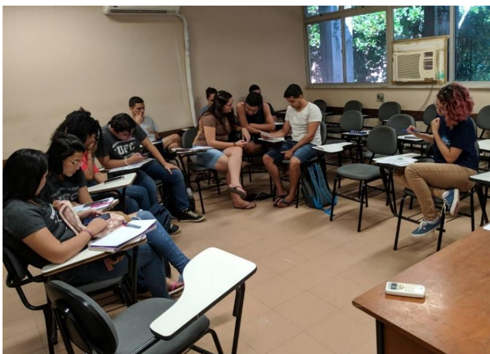
Imagem 1 – encontro do grupo de estudos.

O grupo de estudos foi divulgado para os discentes do primeiro, segundo e terceiro semestre através de diálogos com este público-alvo. No total do semestre que se realizou o projeto, ocorreram 7 encontros com uma frequência média de 10 alunos. Durante estes encontros, foi perceptível o interesse do público-alvo na discussão dos textos, previamente selecionados pelo projeto ARESCOLA, além da abordagem teórica e prática sobre o mapa cognitivo.