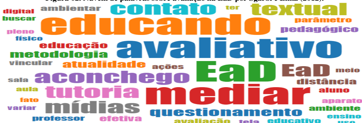
Figura 02. Nuvem de palavras sobre avaliação na EaD por Sgarbi e Lima (2012).