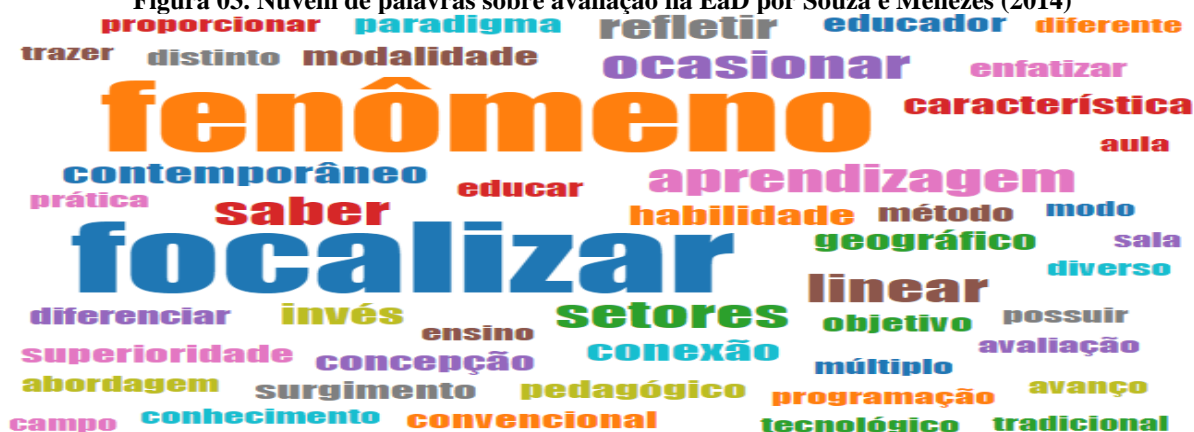
Figura 03. Nuvem de palavras sobre avaliação na EaD por Souza e Menezes (2014)