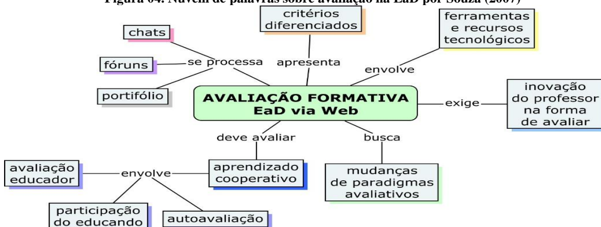
Figura 04. Nuvem de palavras sobre avaliação na EaD por Souza (2007)