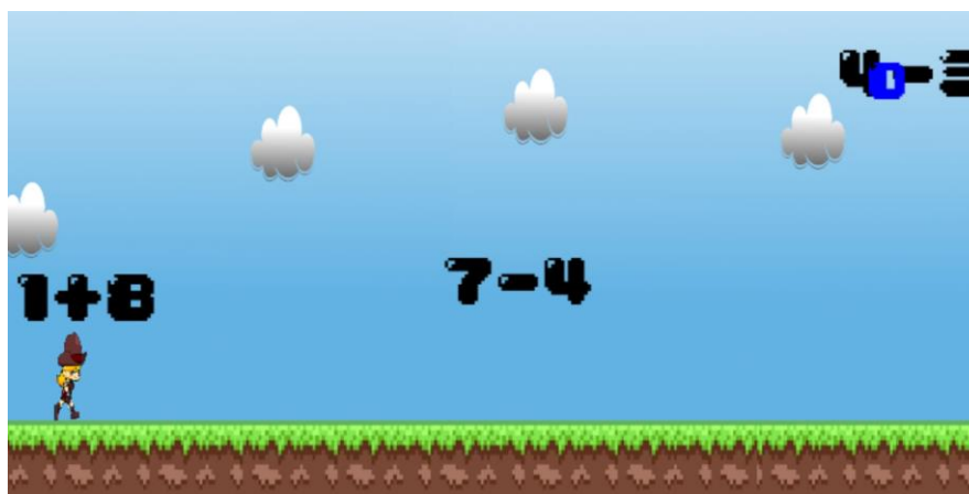
Figura 3: Resolvendo operações matemáticas.

Na figura 3 é possível visualizar o personagem do jogador, que corre constantemente para a direita. No topo a direita da tela é possível visualizar a pontuação, ela está na cor azul. As operações matemáticas são desenvolvidas de forma aleatória, para escolher uma das operações o jogador deve pular com o personagem assim selecionado a operação. O processo para resolver é parecido, mas o jogador terá que saltar para escolher o resultado, se o resultado estiver correto ele ganha um ponto, caso esteja errado perde um ponto.