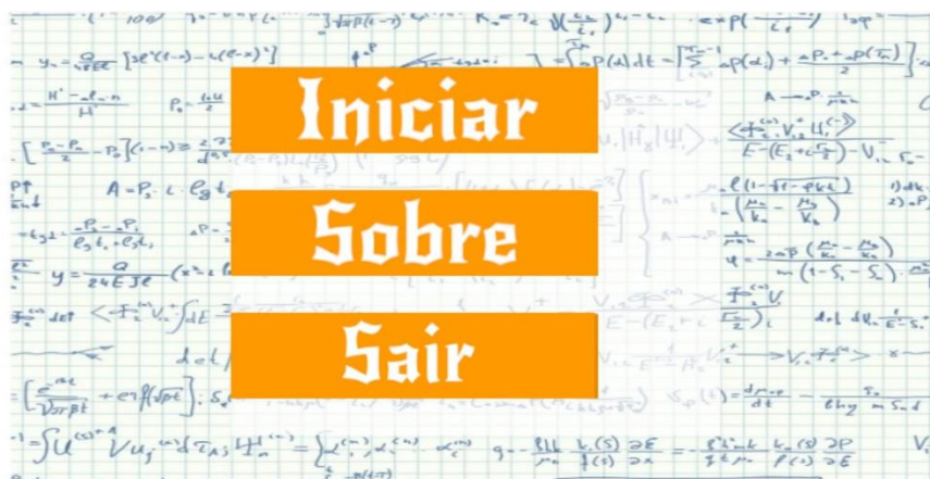
Figura 2: Menu inicial do OXEMAT