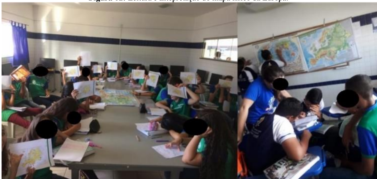
Figura 02: Leitura e Interpretação do mapa físico da Europa.

A princípio, fez-se a apresentação dos conteúdos físicos naturais do continente europeu com o suporte da base cartográfica. Através da projeção de mapas foi construída a primeira atividade, com o objetivo de desenvolver o raciocínio geográfico do aluno, através da localização geográfica do objeto de estudo e, em seguida, possibilitar a compreensão dos fenômenos físicos geográficos e sua distribuição no continente europeu, através das leituras dos mapas. Para a construção desse conhecimento utilizamos a leitura e interpretação dos mapas físicos do continente e finalizamos com a leitura e interpretação deles. (Figura 01)