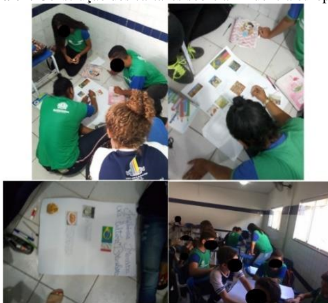
Figura 04: Construção dos cartazes sobre a influência europeia no Brasil.

Em sequência, iniciando a terceira etapa a partir de aulas expositivas sobre a influência europeia no território brasileiro, deu-se início às discussões buscando compreender até que ponto a cultura europeia contribuiu para a formação do povo brasileiro. Grupos foram montados nas turmas onde cada um pesquisaria sobre um país europeu buscando identificar qual foi a influência para a formação do Brasil. A confecção dos cartazes é visível na figura 04.