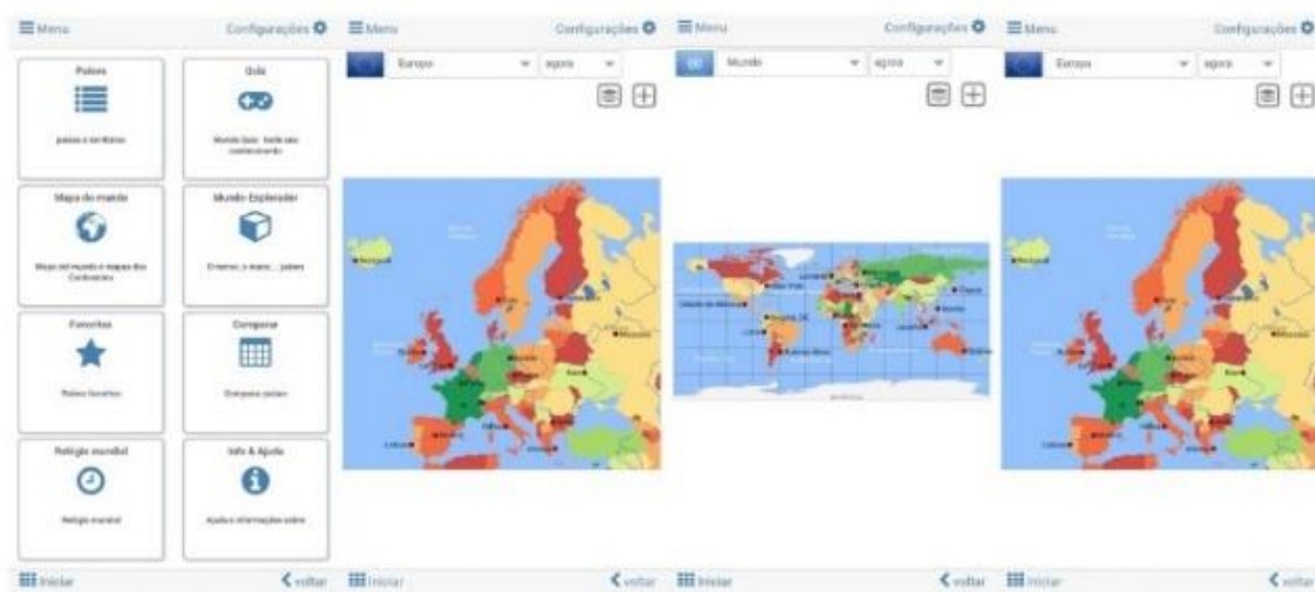
Figura 02: Visão geral de algumas ferramentas do Aplicativo MXGeo.

Seguindo a metodologia, teve início a segunda etapa, que teve como objetivo a utilização das tecnologias na compreensão dos fenômenos geográficos. Para isso, utilizamos os Smartphones dos alunos com o apoio do aplicativo MXGeo, buscando uma forma de utilizar o celular com uma ferramenta para a construção do conhecimento geográfico, pois sabe-se que muitas vezes esse aparelho é um vilão nas aulas de todas as disciplinas. A partir dessa problemática, surgiu o questionamento de porque não utiliza-lo como ferramenta. Seguimos e realizamos conforme a Figura 02.