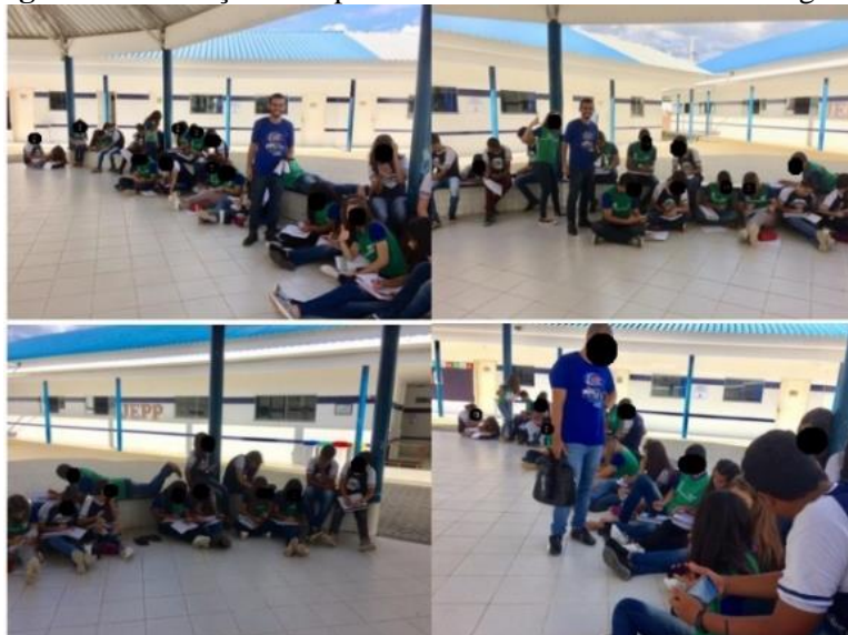
Figura 3: Utilização do Aplicativo MXGeo no ensino de Geografia

aparece com uma ferramenta para auxiliar o professor em suas atividades. O uso dos celulares aconteceu em dois encontros, visualizados na figura 03.