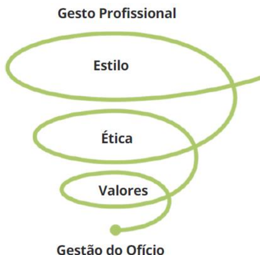
Figura 1: Representação do salto qualitativo em pilares do Gesto do ofício para Gesto Profissional

O salto qualitativo, para o gesto profissional se dá a partir do estilo, dos valores e da ética (Figura 1), sendo esses pressupostos essências para a atuação de forma qualitativa enquanto professor. Neste contexto, o agir docente, analisado diante do fenômeno, que é a prática educativa docente engendra pelo gesto profissional, sinaliza os estilos próprios, a postura ética e os valores do agir profissional.