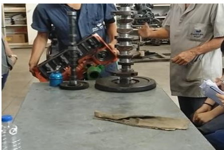
Foto 1: Incentivar os alunos, participação do aluno, atuação com domínio.