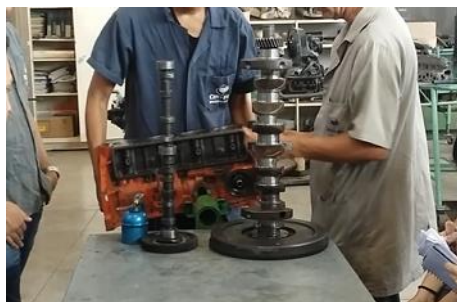
Foto 2: Participação do aluno, atuação com domínio, reconhecimento da existência do aluno

A autonomia é o incentivo dos próprios alunos, e essa postura é um registro observável nessa primeira análise, marca uma parte considerável da atuação do professor, que se replica nos alunos diante da prática proposta pelo docente. Durante a prática, o professor transparece o seu objetivo, mediante a linguagem verbal e não verbal, esclarecendo aos alunos o que pretende com a atividade.