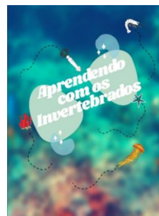
Figura 2 – Verso das cartas, design criado pelo aplicativo Canva.