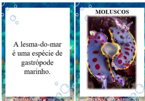
Figura 1 – Exemplo de modelo de carta, Filo Mollusca

Elaborou-se 120 cartas de tamanho de 7 cm de largura por 9,65 cm de comprimento (Figura-1) com informações relevantes, relacionadas a alguns filos e classes de invertebrados marinhos. Além das informações retiradas do livro, as cartas continham imagens dos invertebrados ou de suas estruturas corporais, sendo assim, as cartas podem ser conjugadas formando pares das informações com as imagens. Portanto, foram criadas 60 cartas de informações e 60 de imagens. As imagens contidas nas cartas foram retiradas de sites da internet relacionados ao tema. Para o verso das cartas, foi elaborado um design utilizando o aplicativo Canva ( www.canva.com.br ) que auxilia na criação de designs gráficos profissionais (Figura 2).