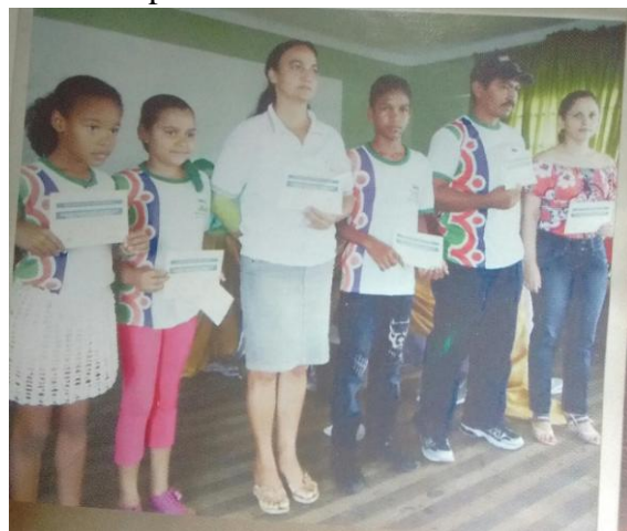
Figura 4 – Concurso de Texto Literário realizado pela AMUNAM.