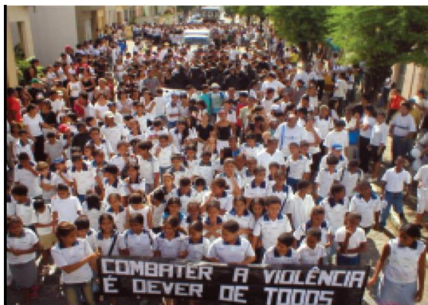
Figura 1 – Ação de enfrentamento a violência contra a mulher com caminhada pelas ruas de Nazaré da Mata