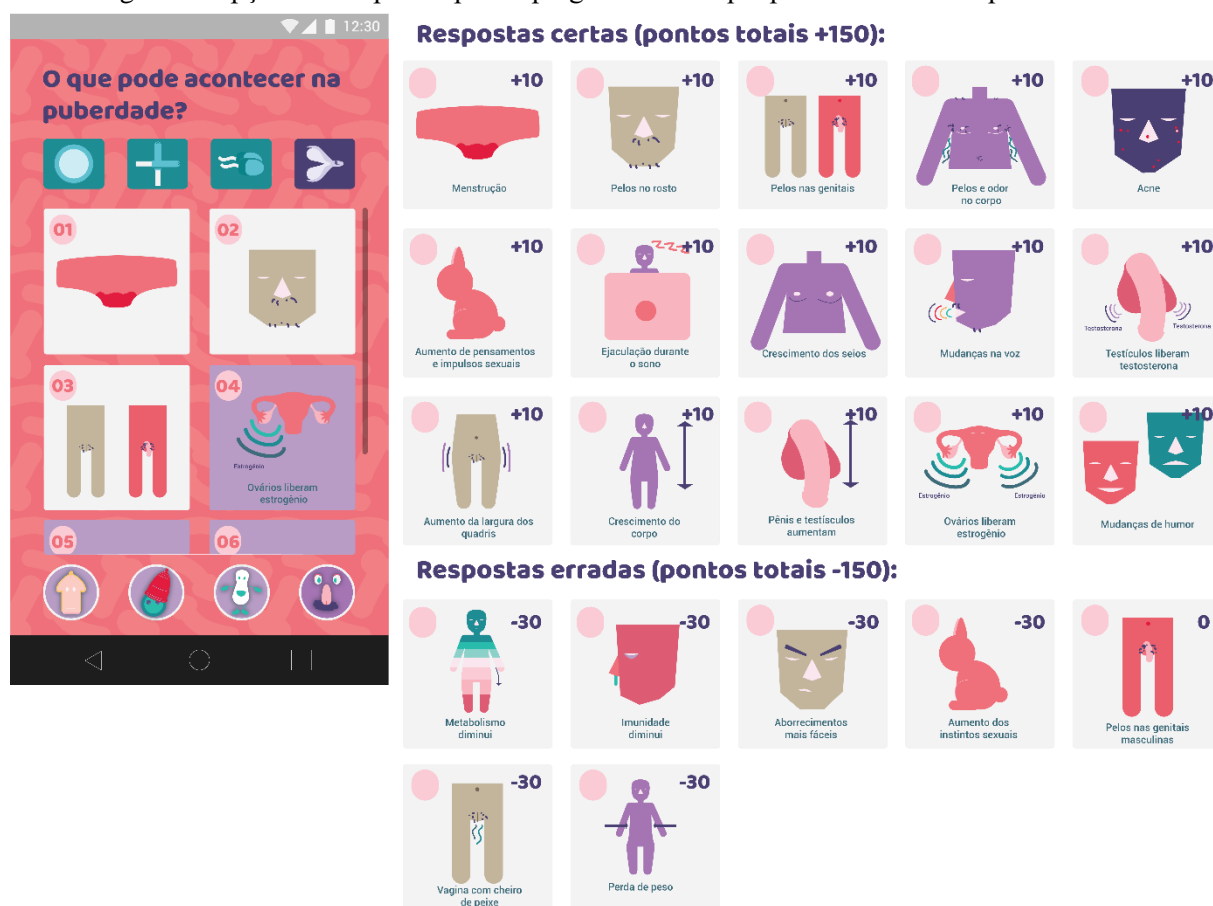
Figura 3: Opções de respostas para a pergunta de “O que pode acontecer na puberdade?”

Ao atribuir-se as pontuações de cada resposta, considerou-se também que alguns jogadores poderiam ser propensos a selecionarem todas as opções de resposta, então o total das respostas selecionadas foi projetado para sempre dar nulo ou negativo.