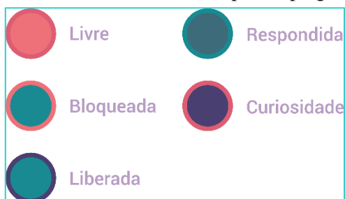
Figura 1: Paleta referente aos tipos de perguntas

A interface do jogo foi desenvolvida de forma que não houvesse muita alteração entre os dois formatos de respostas, para não confundir os jogadores. As perguntas também foram divididas em tipos, cada tipo apresentando um ícone de seleção diferente: