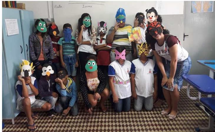
Fotografia 1 - Turma e estagiárias após a contação de história.

relacionando som e grafia e, à medida que falavam, questionamos sobre sua escrita chamando os discentes à frente para escrever as palavras.