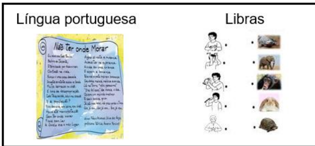
Figura 1 – Língua usada na aprendizagem

Ao perguntarmos a respeito de línguas que o aluno surdo sente mais facilidade para compreender nos conteúdos estudados, dispomos a imagem abaixo, para ele pudesse responder: