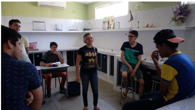
Foto 1: Passagem do texto dissertativo em que os participantes ajudam um ao outro.