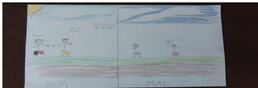
Figura 5 – Desenho do tema “o dia em que fui hostil e me retratei”

Nota: Desenho de uma criança que relata a história dele e de um colega que brigavam muito e, por isso, ele se sentia mal. Depois do projeto de intervenção, eles se aproximaram e se tornaram um dos melhores amigos, o que o fez se sentir bem.