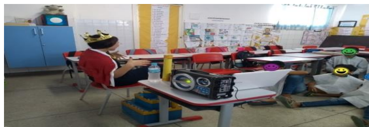
Figura 1 – Momento em que a mediadora interpretou o rei hostil, que governava com hostilidade, raiva e desconfiança

“Olhem para o lado e riam” (mediadora) – Obedeceram