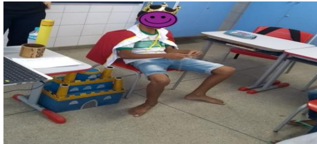
Figura 2 – Momento em que as crianças experimentaram como é um rei empático, governando com docilidade, lealdade e empatia.