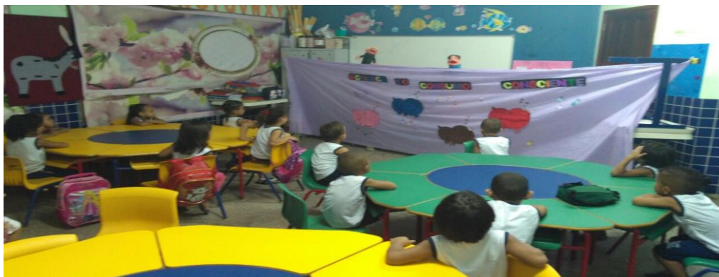
Figura 2 -Crianças assistindo à peça teatral com a temática financeira.