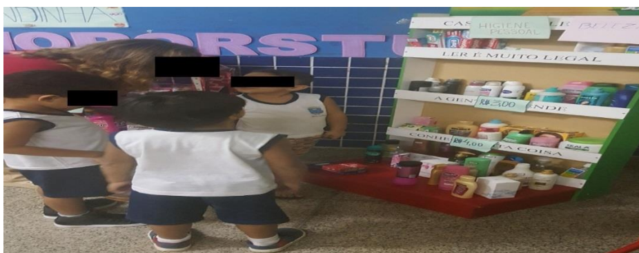
Figura 3 –“Exposição de produtos”.