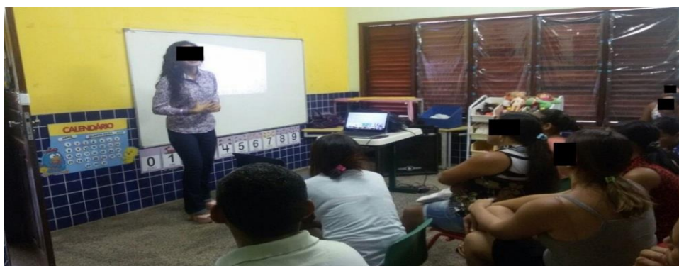
Figura 1 -Palestra sobre “O Consumismo Infantil”.