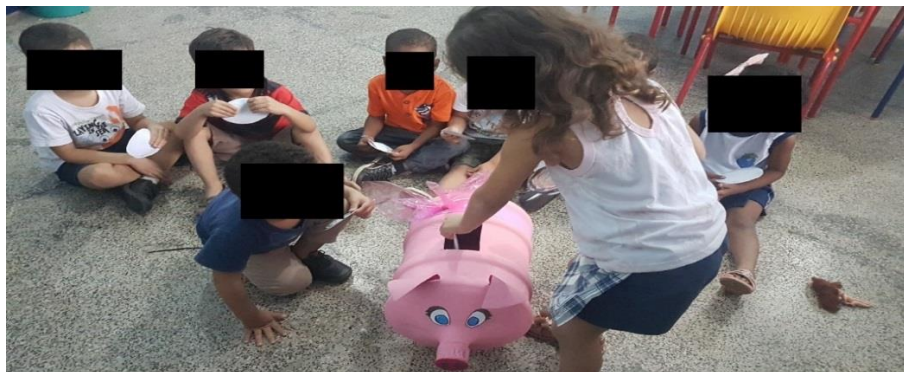
Figura 4 -Crianças brincando de “poupar”.