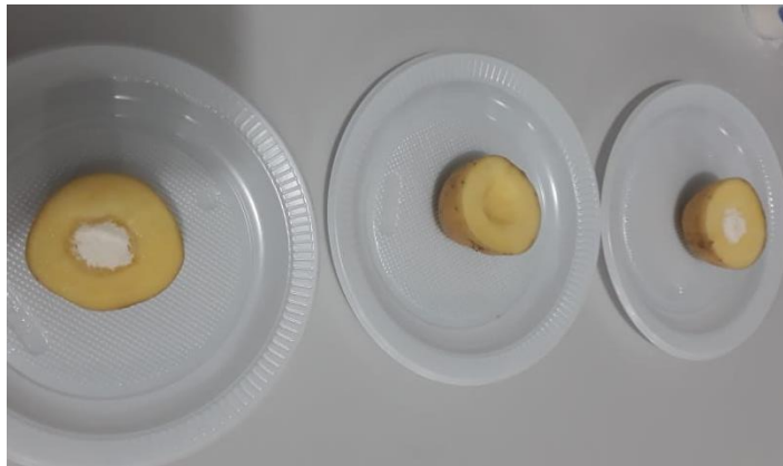
Figura 2. Transporte celular mostrado através da prática “Batatas Choronas” pelos alunos.

Após 10 minutos conseguiu-se ver que os solutos ficaram bastantes úmidos, demonstrando através disso que aconteceu o processo de osmose, em que o solvente (água) presente na batata fosse em busca do meio hipertônico (com maior concentração de soluto), enquanto na batata que fora utilizada como controle, sem a presença de soluto, não aconteceu nada.