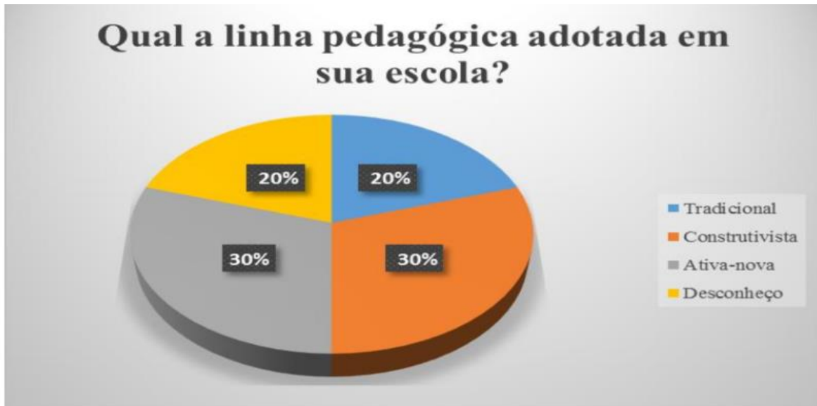
Figura 01. Linhas pedagógicas adotadas nas escolas analisadas de Teresina – PI fonte: próprio autor (2015).

Com relação à utilização de planejamentos pedagógicos, 90% dos profissionais de Teresina analisados disseram fazer uso dessa estratégia constantemente (fig. 02). De acordo com Luckesi (1992), o planejamento é um conjunto de ações que são preparadas projetando um determinado objetivo, em outras palavras é “um conjunto de ações coordenadas visando atingir os resultados previstos de forma mais eficiente e econômica”. É necessário ressaltar que tal estratégia deve ser compreendida como um instrumento capaz de intervir em uma situação real para transformá-la (VASCONCELLOS, 2000).