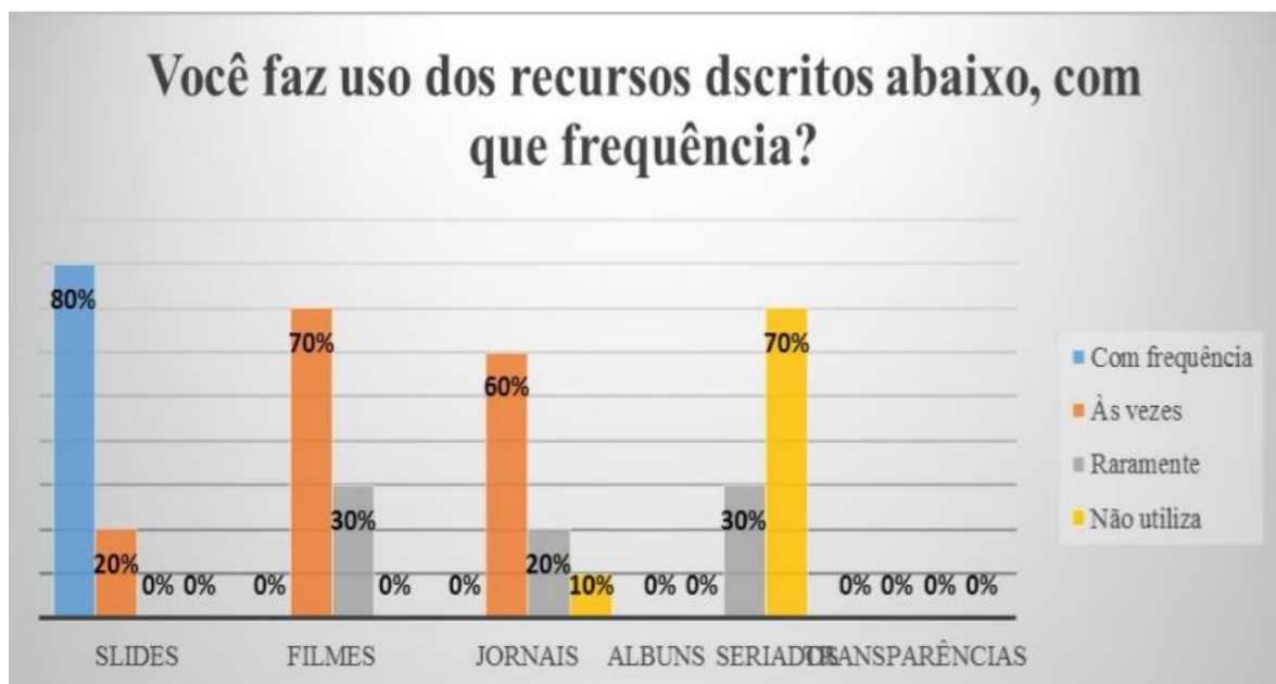
Figura 02 – Recursos utilizados pelos professores das escolas de Teresina.

O slide servem de apoio ao professor. Eles não são a aula. Um número excessivo de imagens de nada serve. Deve ser deixado um número de imagens adequado ao tempo disponível. Lembre-se que a imagem deve ter poder de síntese (MOREIRA, 1990, p. 9).