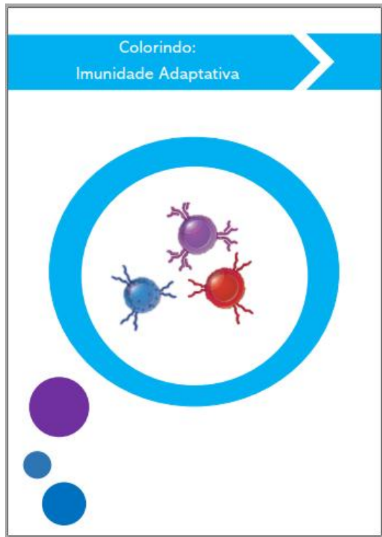
Figura 1:Capa da cartilha colorindo:imunidade adaptativa