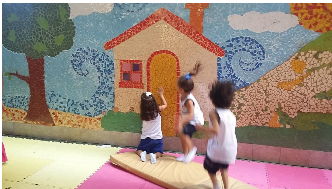
Figura 1 - Atividades no pátio.